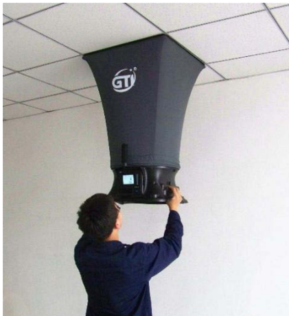
风量罩测试散流器风口风量实例

风量罩能迅速准确地测量风口平均通风量，风量罩配备相应的传感器可以直接读出风速、压力和相对温湿度，尤其适用于对于散流器式风口。使用时将罩口紧贴天花面，使风口整体完全包容，就可以直接读取数据。当采用风量罩测量风口风量时，应选择与风口面积较接近的风量罩体，罩口面积不得大于4倍风口面积，且罩体边长不得大于风口长边的2倍。风口宜位于罩体的中间位置，罩口与风口所在平面应紧密接触、不漏风。