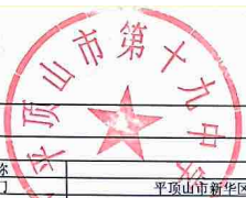
项目支出绩效自评情况表