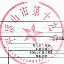
项目支出绩效自评情况表